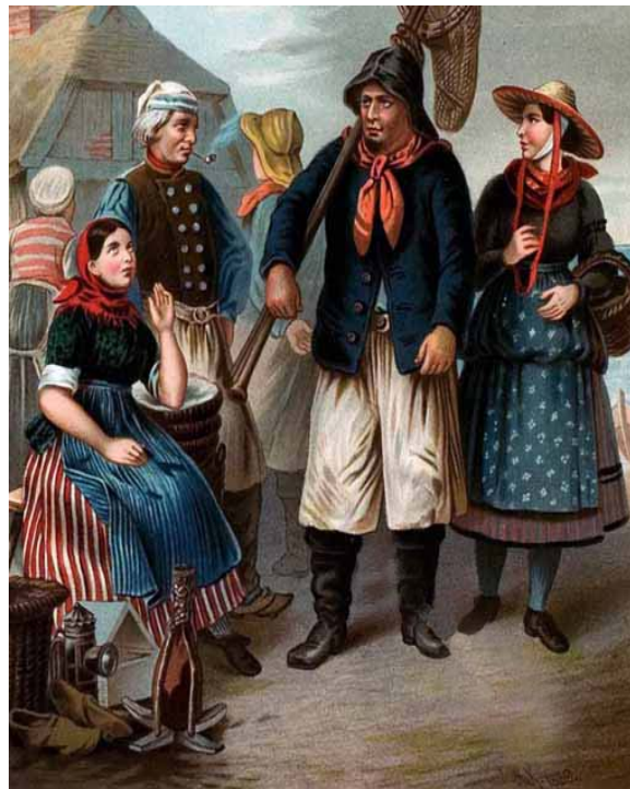
Trachten aus Schleswig Holstein ... .. Schleswig