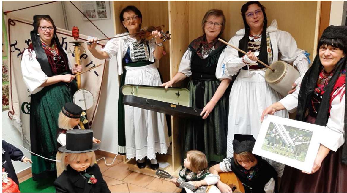
Thüringer musizierende Damen mit typischen Volkstrachten