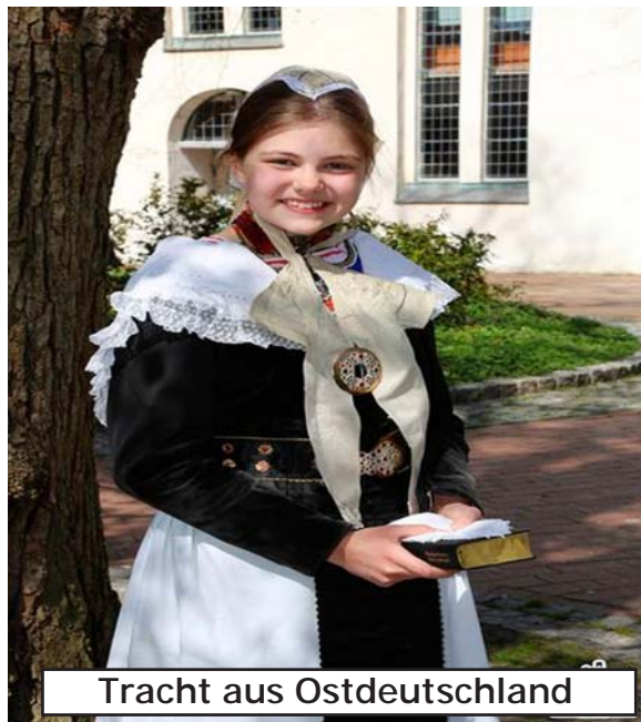
Tracht aus Ostdeutschland