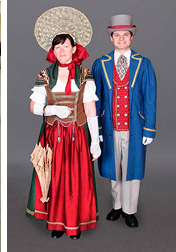
Tracht in Oberschwaben