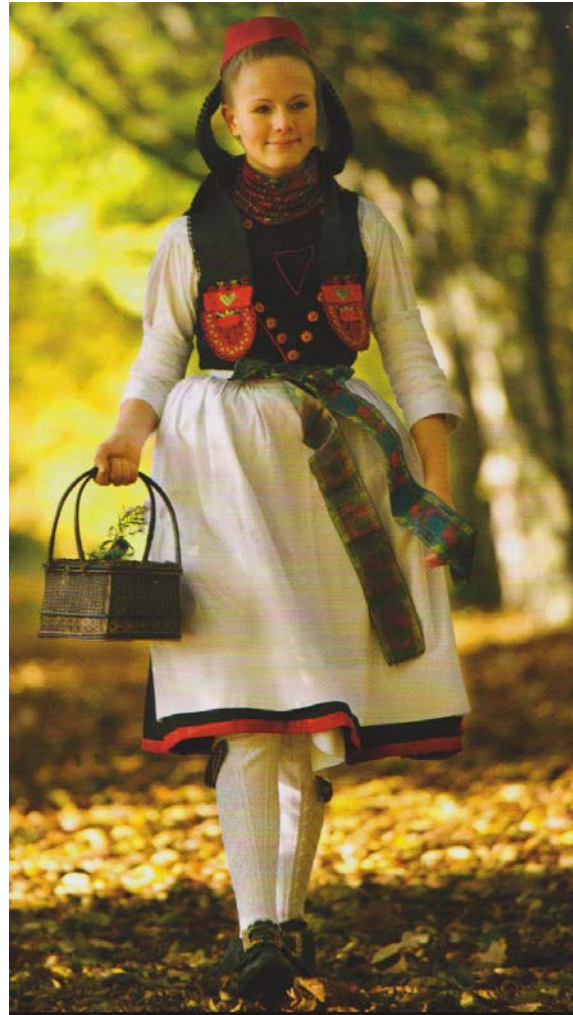
Tracht aus dem Rotkäppchenland „Schwalm“